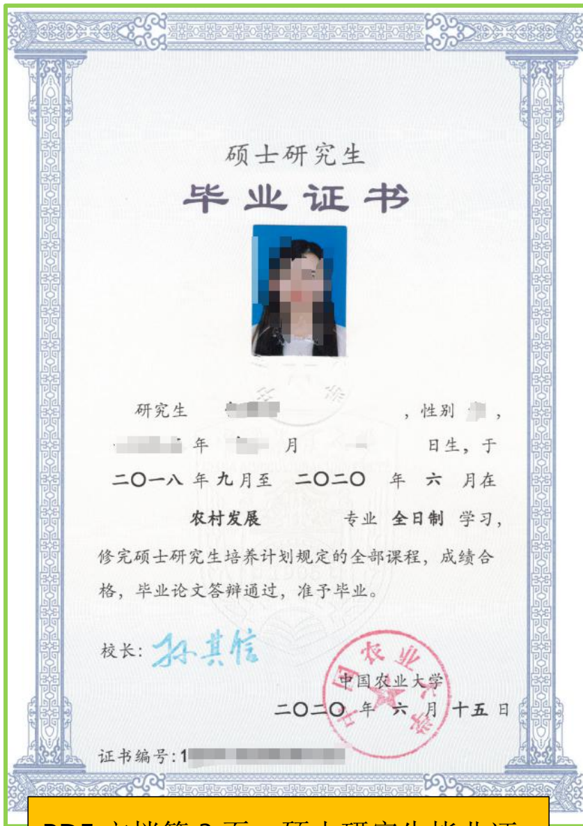
PDF 文档第 3 页，硕士研究生毕业证