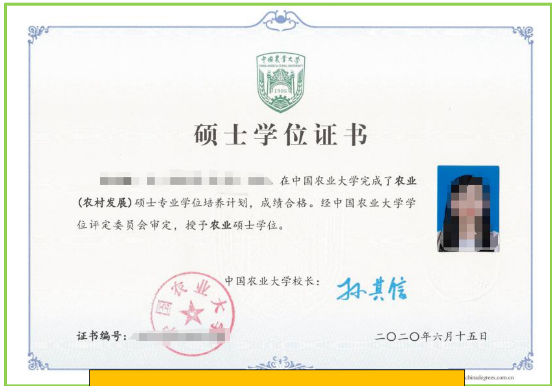
PDF 文档第 4 页，硕士研究生学位证